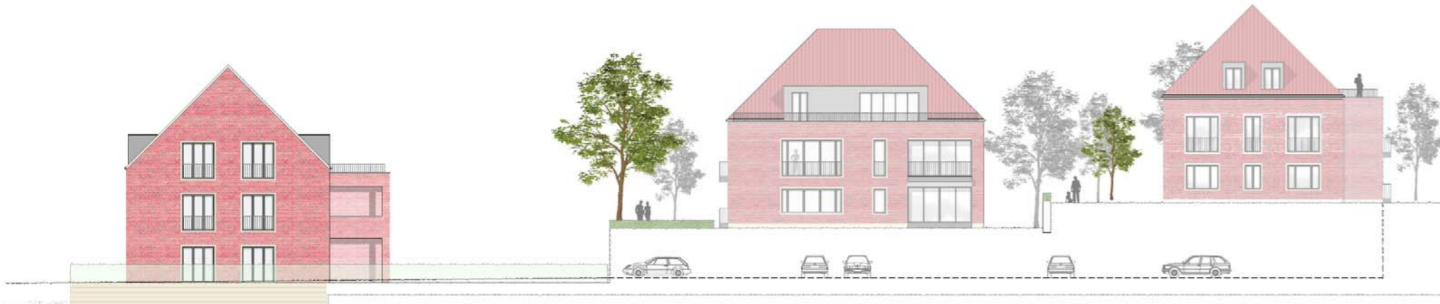
Sicht An der Feuerwache, Ambulante Pflege und Haus 4, 3