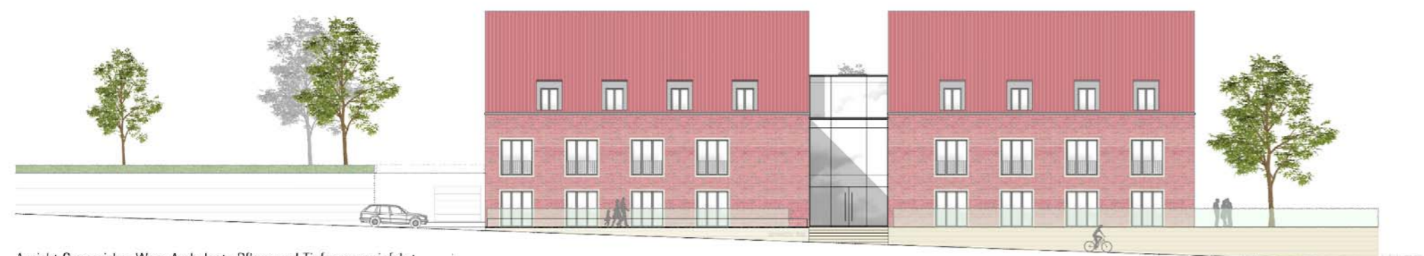
Sicht Gennericher Weg, Ambulante Pflege und Tiefgarageneinfahrt