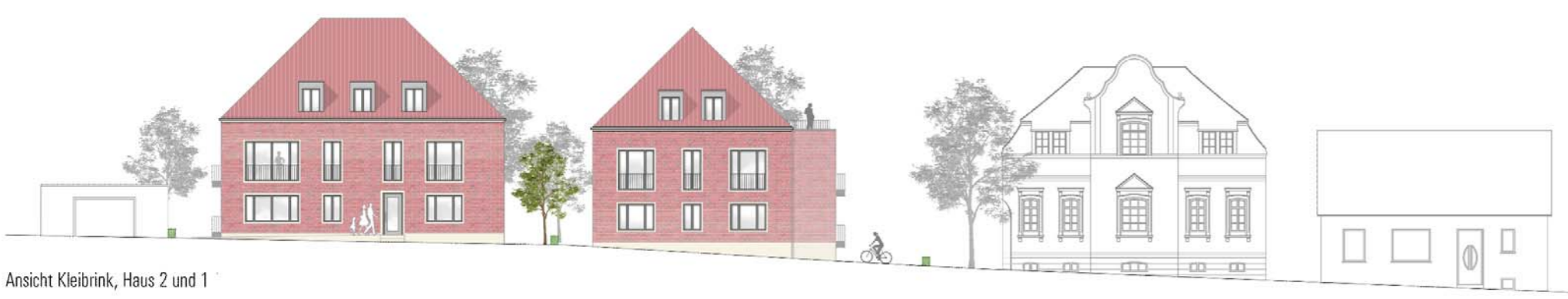
Sicht Kleibrink, Haus 2 und 1