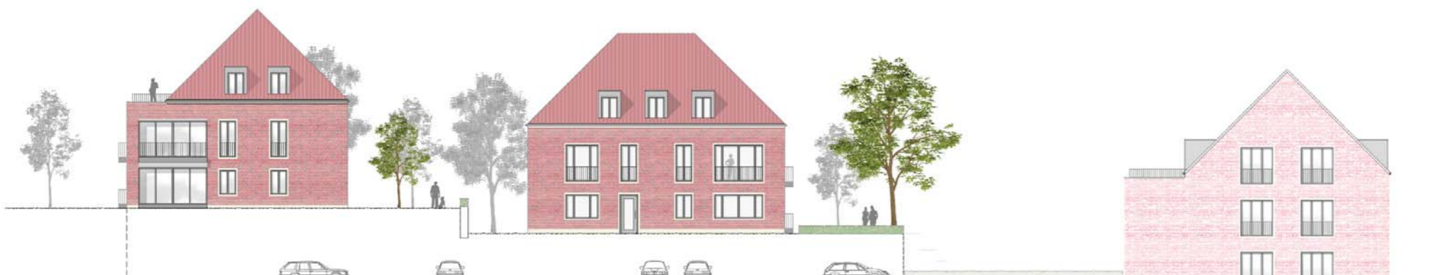
Sicht Kleibrink, Haus 3, 4 und Ambulante Pflege